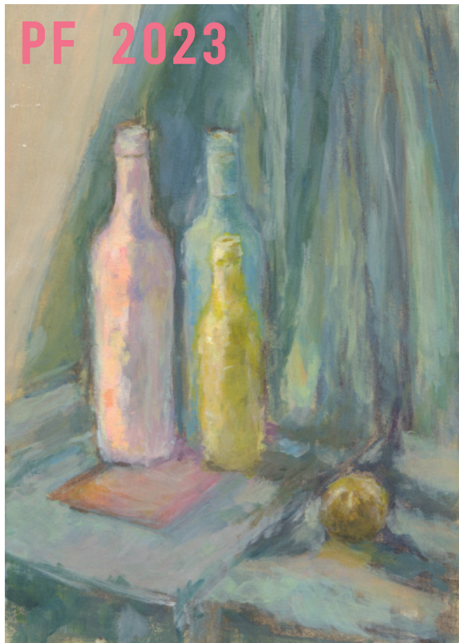
Filip Hrdlička malba zátíší 2022

Přejeme Vám krásné Vánoce a šťastný nový rok 2023