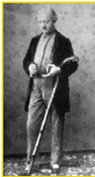
Jules Joseph Perrot