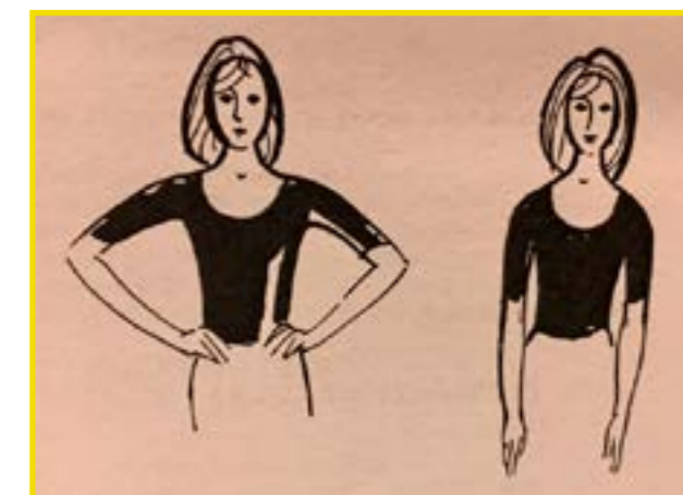
Polohy paží I.