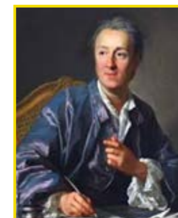
Charles Louis Didelot