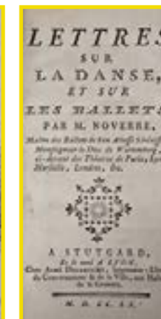
Listy o umění jak stavět balety