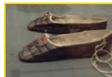
Didelotovy baletní boty