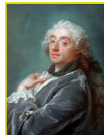
Jean George Noverre