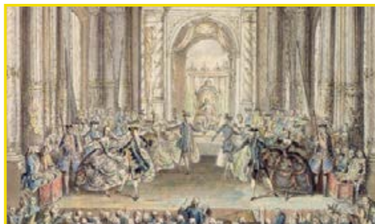
Ballet de Cour