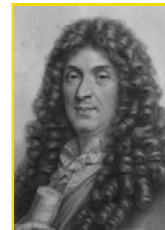
Jean Baptiste Lully