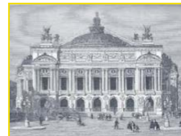
L'Académie Royale de Danse